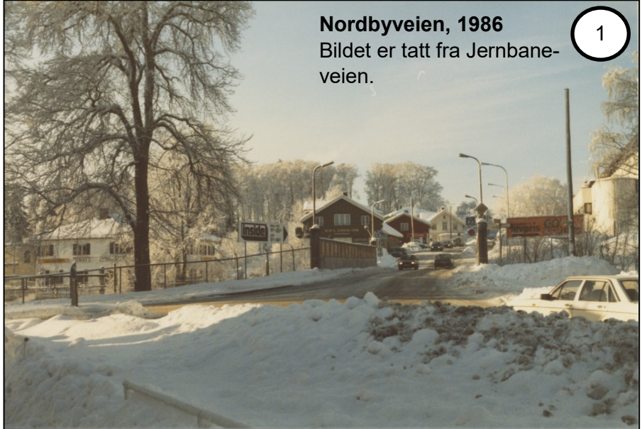
Nordbyveien, 1986 Bildet er tatt fra Jernbane- veien.