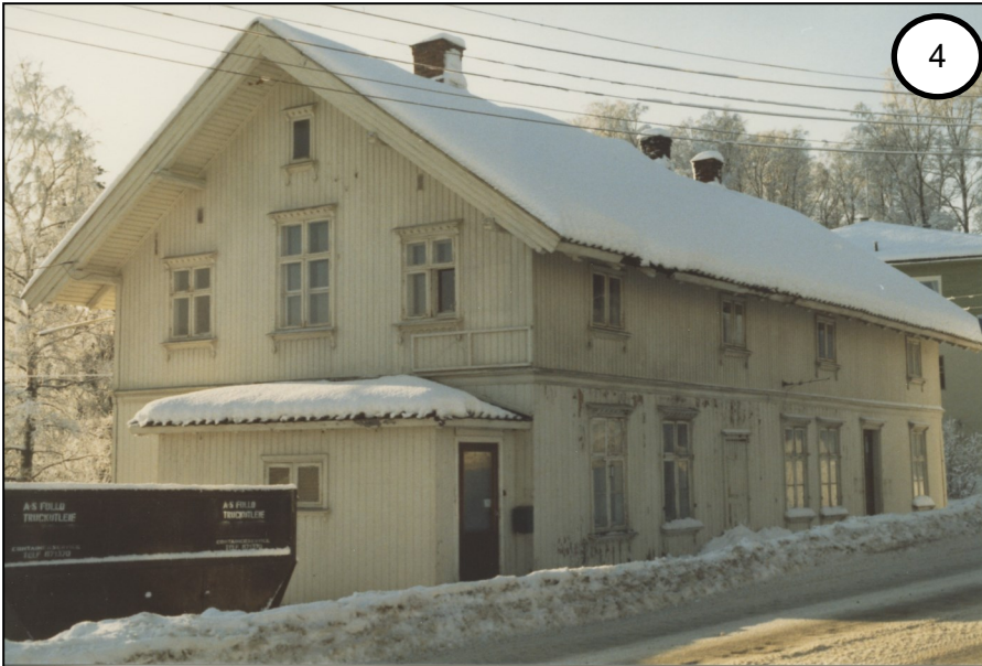
Wergelands Minde, 1986.