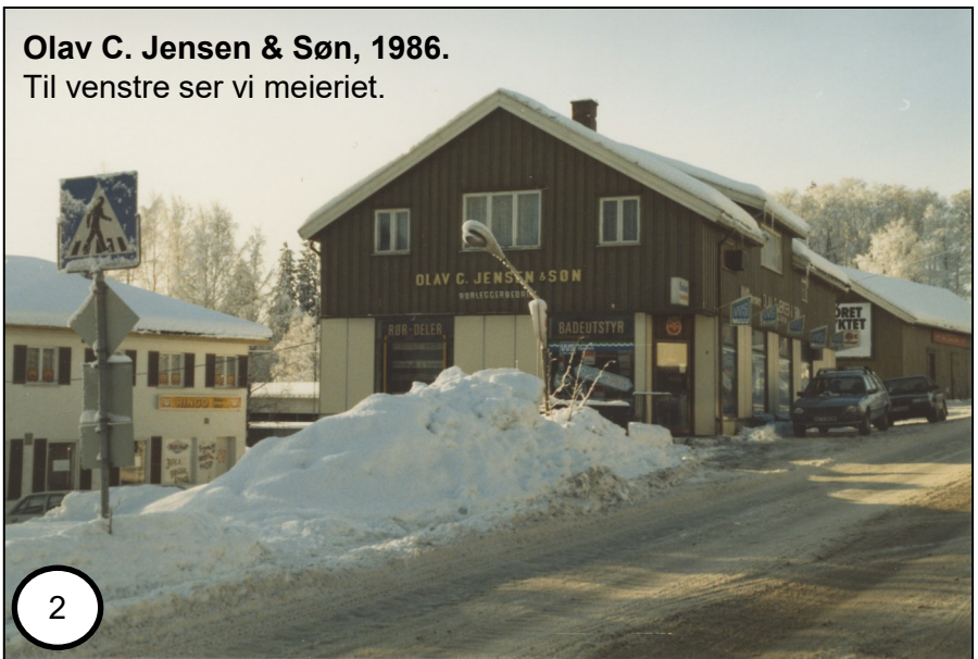
Olav C. Jensen & Søn, 1986. Til venstre ser vi meieriet.

Fotonummer: SKIB 005 054.