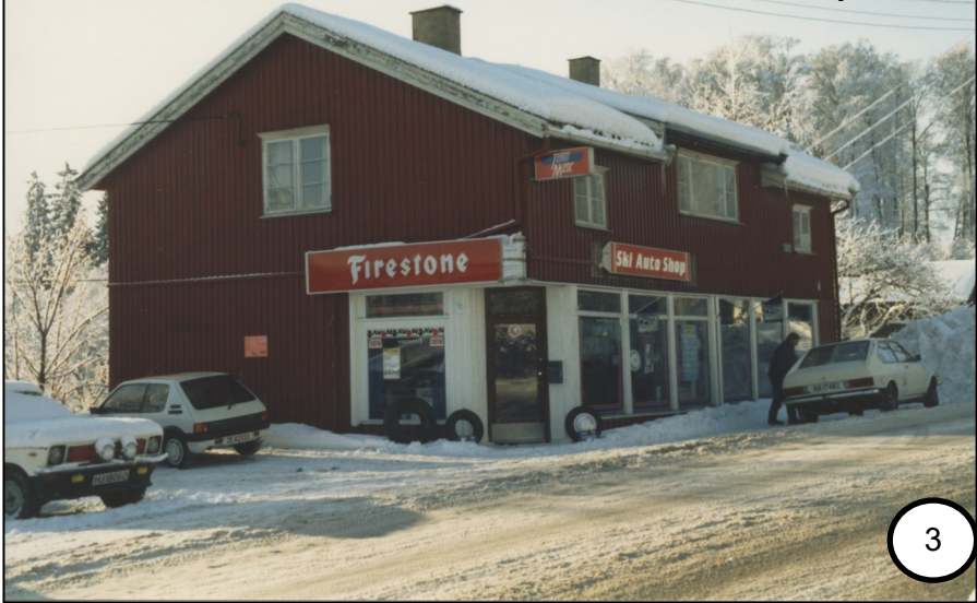
Ski Auto Shop, 1986.